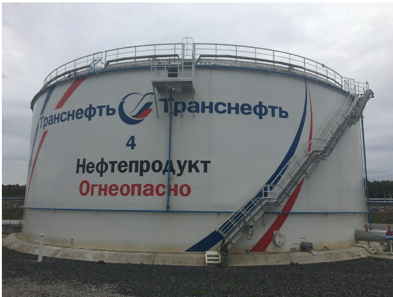
Рисунок 2 - Общий вид резервуара вертикального стального цилиндрического РВС-10000