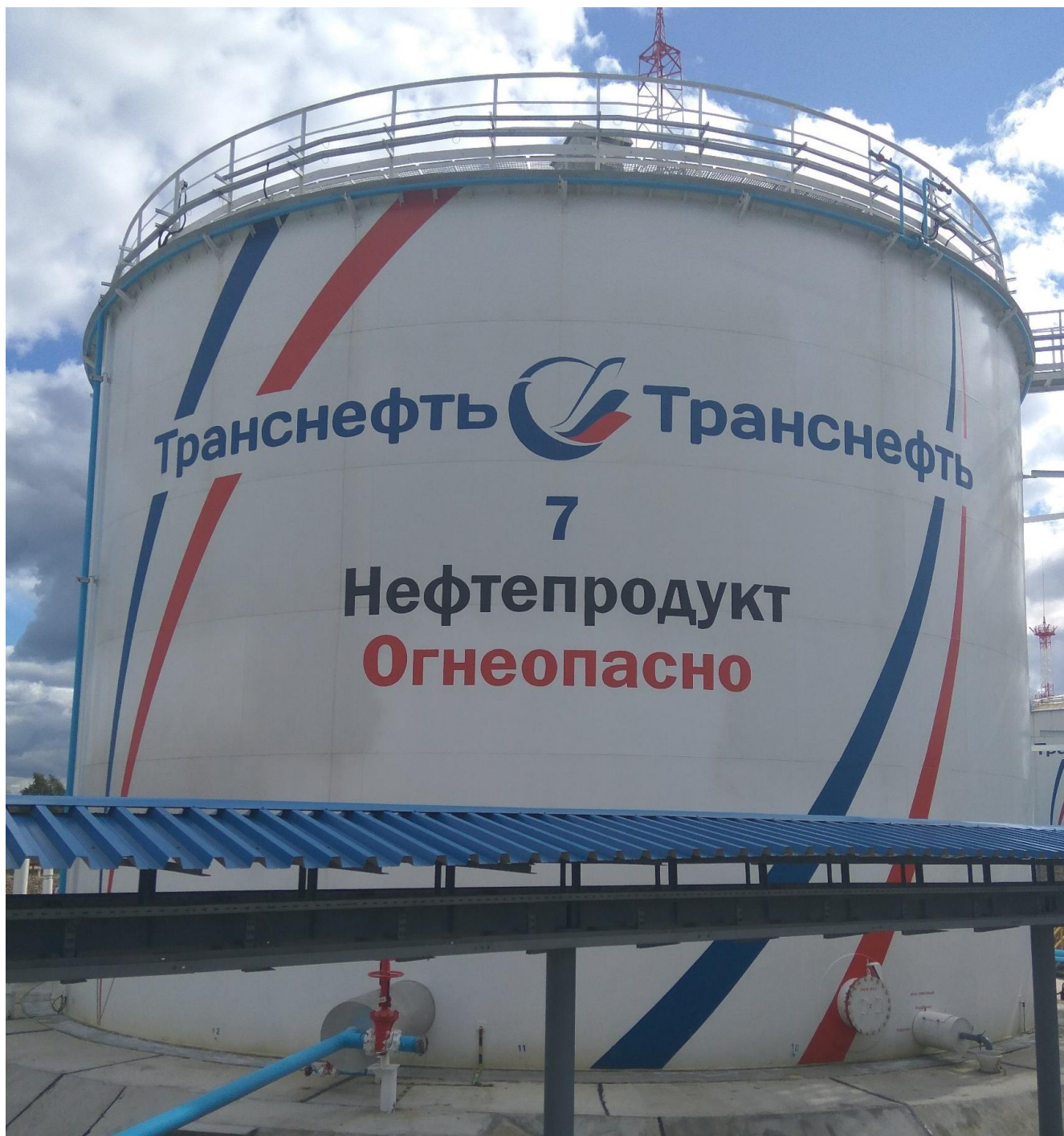
Рисунок 1 - Общий вид резервуара вертикального стального цилиндрического РВС-3000

Общий вид резервуаров вертикальных стальных цилиндрических РВС-3000, РВС-10000, РВСП-10000 представлен на рисунках 1 - 3.