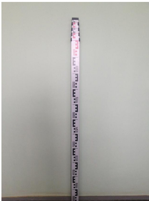
Рисунок 1 - Внешний вид рейки

Места для размещения знака утверждения типа приведены на рисунке 4.