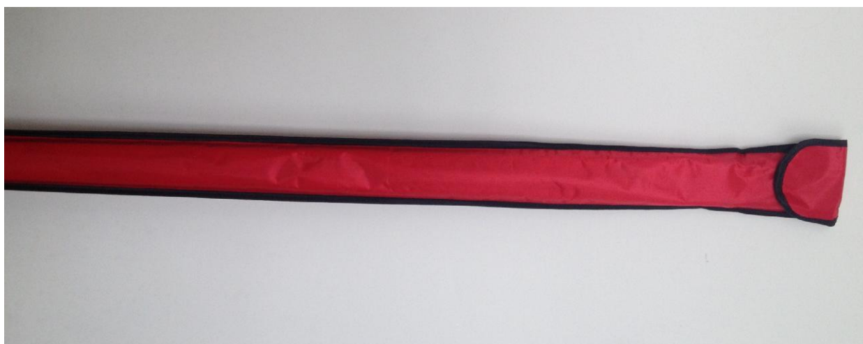
Рисунок 3 - Внешний вид защитного чехла