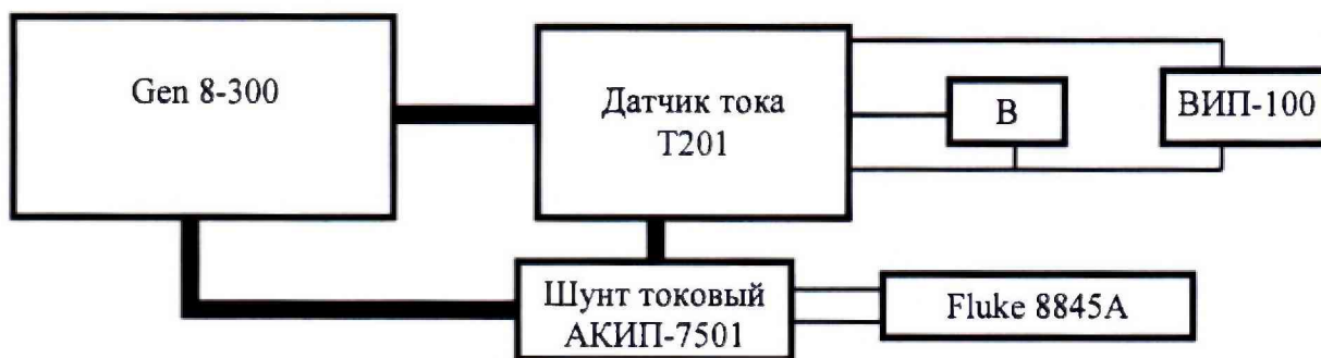
«В» - мультиметр Fluke 8845A в режиме измерения напряжения постоянного тока. Рисунок 4 – Схема измерений силы постоянного тока для датчика с выходным сигналом от 0 до 10 В

8.3.2 Включите мультиметр Fluke 8845A, подключенный к датчику тока T201 модификации T201DCH, T201DCH100, T201DCH300 в режим измерения напряжения постоянного тока, а для модификаций T201DC, T201DC100, T201DCH50-LP, T201DCH100-LP, T201DCH300-LP в режим измерения силы постоянного тока. На источнике питания ВИП-100 установите напряжение постоянного тока, в соответствии с руководством по эксплуатации на поверяемую модификацию. С помощью DIP переключателей на поверяемом датчике включите младший поддиапазон измерений.