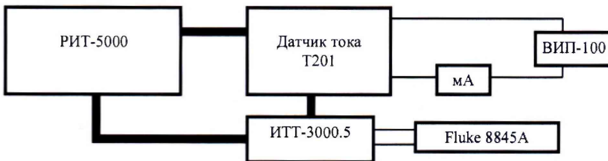
«mA» - мультиметр Fluke 8845A в режиме измерения силы постоянного тока. Рисунок 5 – Схема измерений силы переменного тока для датчика с выходным сигналом от 4 до 20 mA