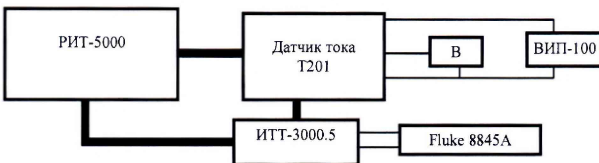
«В» - мультиметр Fluke 8845A в режиме измерения напряжения постоянного тока. Рисунок 6 – Схема измерений силы переменного тока для датчика с выходным сигналом от 0 до 10 В

8.4.2 Включите мультиметр Fluke 8845A, подключенный к датчику тока Т201 модификации Т201DCH, Т201DCH100, Т201DCH300 в режим измерения напряжения постоянного тока, а для модификаций Т201, Т201DCH50-LP, Т201DCH100-LP, Т201DCH300-LP в режим измерения силы постоянного тока. На источнике питания ВИП-100 установите напряжение постоянного тока, в соответствии с руководством по эксплуатации на поверяемую модификацию. С помощью DIP переключателей на поверяемом датчике включите младший поддиапазон измерений.