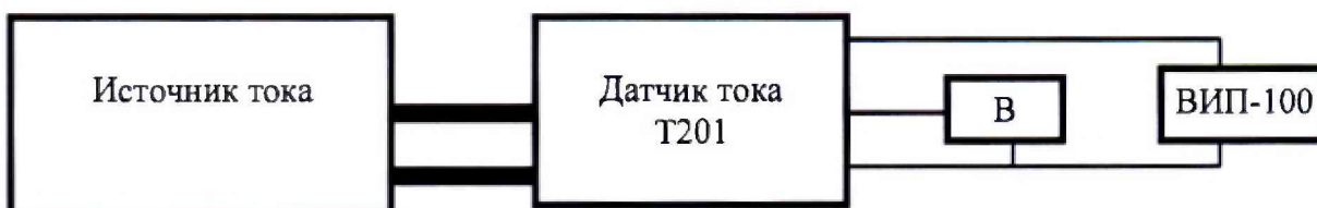
Рисунок 1 – Схема измерений силы постоянного и переменного тока для датчика с выходным сигналом от 4 до 20 мА

«В» - мультиметр Fluke 8845A в режиме измерения напряжения постоянного тока.