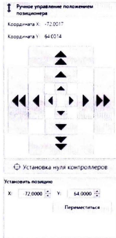
Рисунок 2 – Меню программы для ручного управления движением сканера

Перемещая антенну-зонд с установленным оптическим отражателем вдоль оси Ox в пределах рабочей зоны сканера с шагом \lambda_{min}/2 , где \lambda_{min} - минимальная длина волны, соответствующая верхней границе диапазона рабочих частот комплекса, до срабатывания механического ограничителя, фиксировать показания системы лазерной координатно-измерительной Leica AT401.