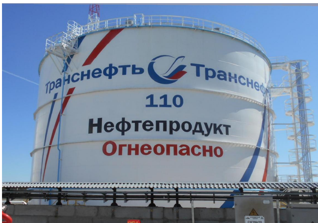
Рисунок 3 - Общий вид резервуара вертикального стального цилиндрического РВСП-10000