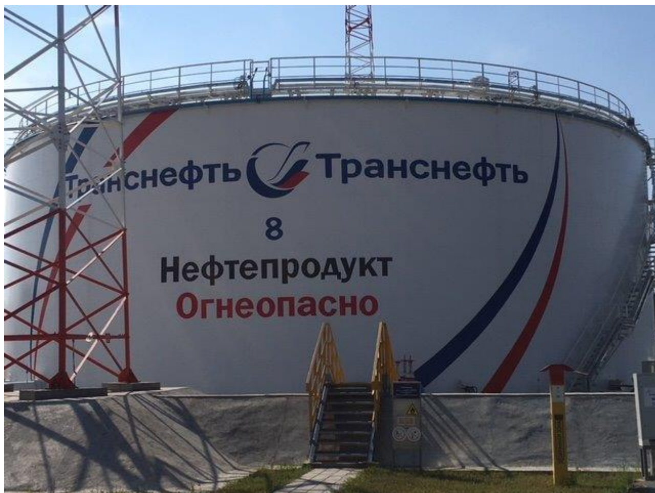
Рисунок 1 - Общий вид резервуара вертикального стального цилиндрического РВС-10000

Общий вид резервуаров вертикальных стальных цилиндрических РВС-10000, РВС-20000, РВСП-10000, РВСПК-50000 представлен на рисунках 1, 2, 3, 4.