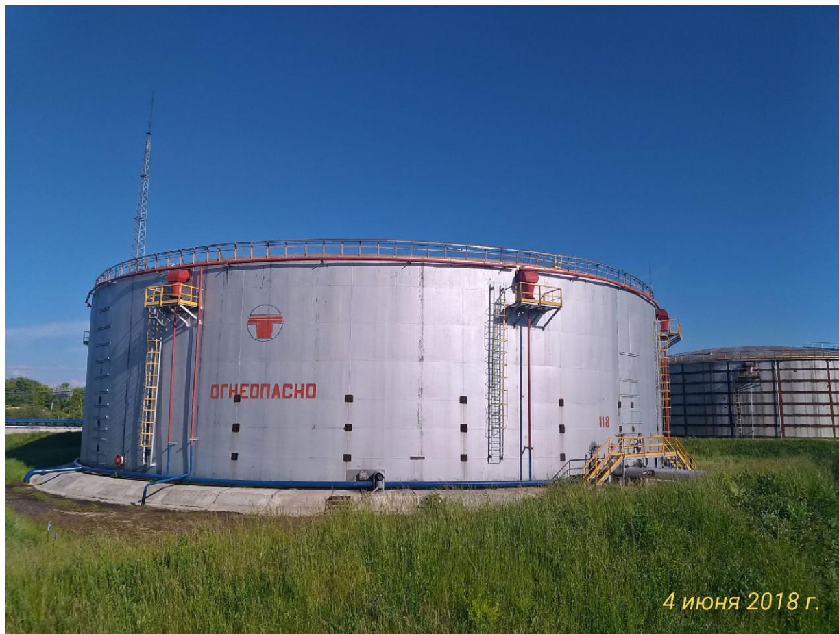
Рисунок 2 - Общий вид резервуара вертикального стального цилиндрического РВС-20000