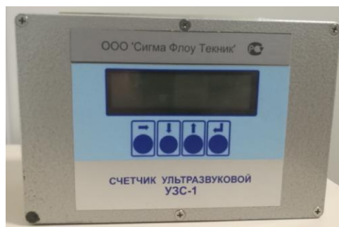
электронный преобразователь (ЭП)

Схема пломбировки от несанкционированного доступа, обозначение места нанесения знака поверки представлены на рисунке 2.