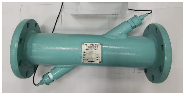
преобразователь расхода одноканальный