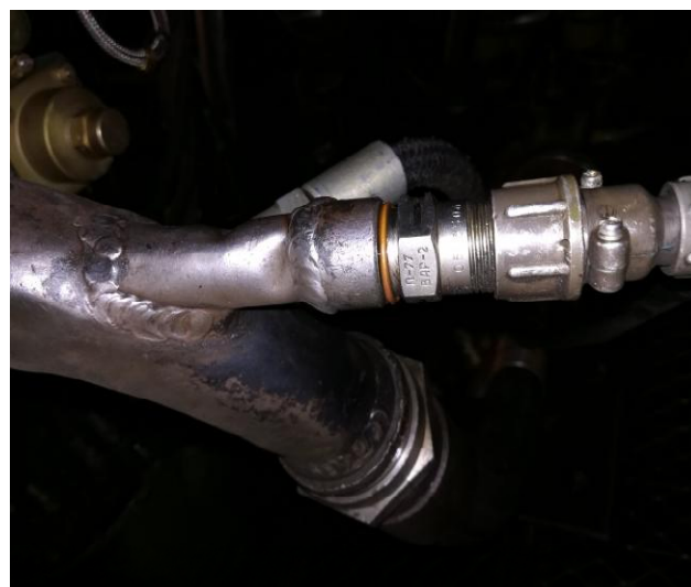
Рисунок 10 - Терморезистивный преобразователь (термосопротивление с номинальной статической характеристикой П100) П-77