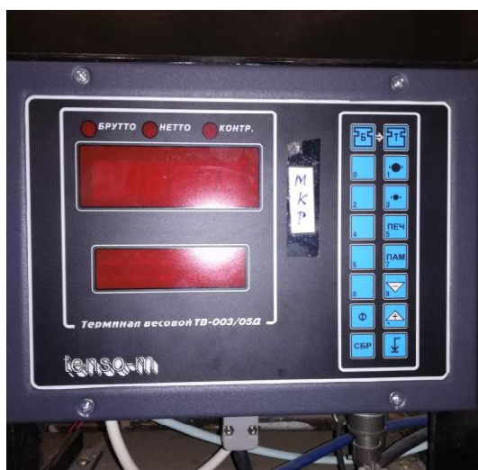
Рисунок 5 - Измеритель (весовой терминал) ТВ-003/05Д