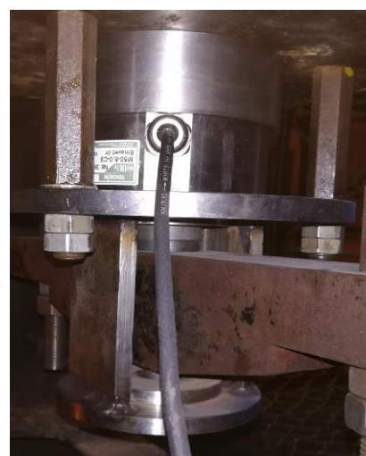
Рисунок 6 - Датчик весоизмерительный тензорезисторный М50-5,0-С3