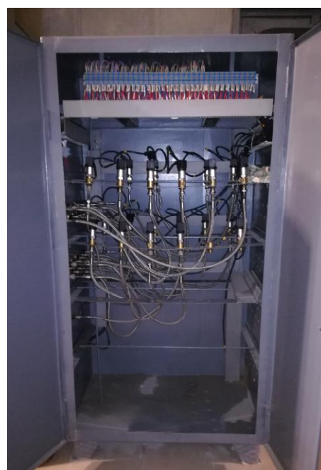
Рисунок 2 - Шкаф датчиков давления (ШкДД) Рисунок 2.1 – ШкДД (открытый)