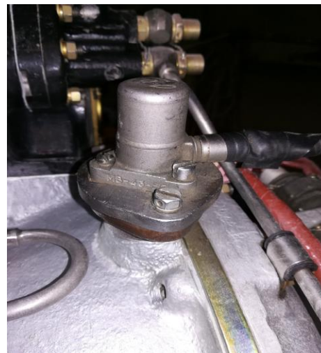
Рисунок 8 - Преобразователи вибрации МВ-43-5Б