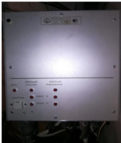
Рисунок 3 - Аппаратура измерения роторных вибраций ИВ-Д-ПФ-1М. Блок преобразования электронный БЭ-38-1М.3.2-01