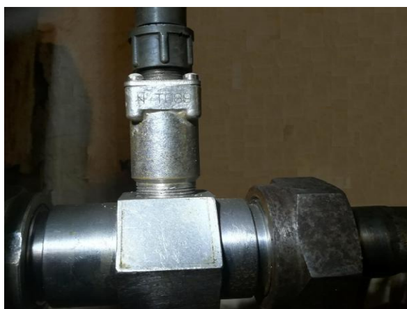
Рисунок 11 - Турбинный преобразователь расхода ТПР-13-2-1