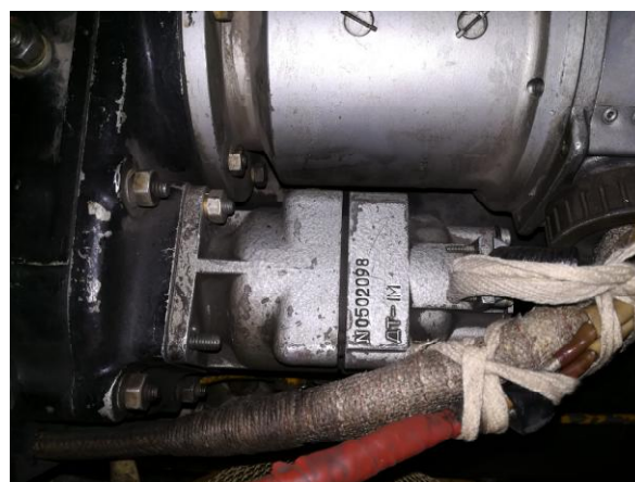
Рисунок 12 - Датчик тахометров ДТ-1М