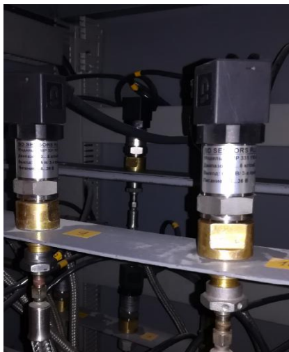
Рисунок 7 - Первичный преобразователь (датчик) давления DMP 331