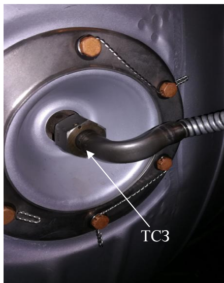
Рисунок 9 - Термоэлектрический преобразователь (термопара) с номинальной статической характеристикой ХА(К) ТСЗ