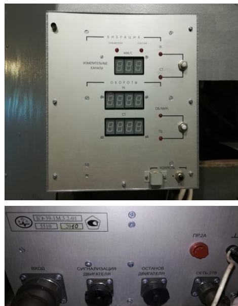
Рисунок 4 - Аппаратура измерения роторных вибраций ИВ-Д-ПФ-1М. Блок Отображения электронный БЭ-39-1М.3.2-01